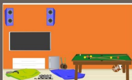
un cuarto de juegos